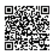
「ラーケーションの日」活動事例集